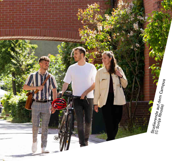
Studierende auf dem Campus