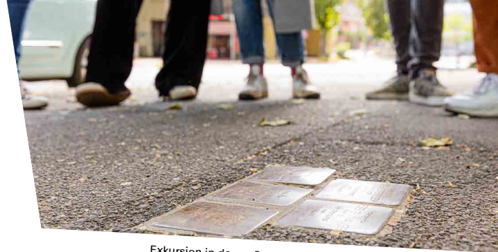
Exkursion in den außeruniversitären Bereich